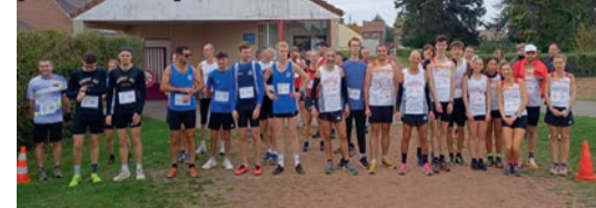
Départ de la course

➔ La deuxième manifestation s'est tenue le dimanche 19 octobre à l'occasion du 7ème Mémorial André LELEU, un cross dans l'enceinte du complexe sportif Francis CHEVALIER et sa marche nature. Belle participation avec plus de 200 participants qui ont permis de récolter plus de 600€ au profit de l'association du dispositif d'appui à la coordination qui vient en aide aux personnes atteintes de maladie dégénérative. Les bénévoles du club, ont encore une fois permis d'organiser ce rendez-vous proposé par la municipalité avec succès.