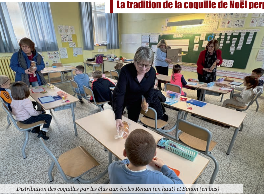
Distribution des coquilles par les élus aux écoles Renan (en haut) et Simon (en bas)

À l'approche des vacances de Noël, la municipalité a une nouvelle fois tenu à faire vivre une tradition chère aux enfants : la distribution de la coquille de Noël. Cette année encore, l'ensemble des élèves des écoles maternelles et élémentaires, ainsi que les équipes éducatives (enseignant(e)s, ATSEM et AESH) ont pu savourer cette brioche typique.