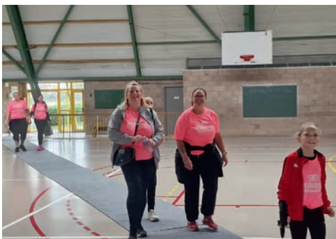
Demi-tour en passant par la salle Pironi...