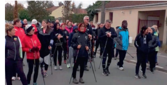
Les marcheurs au départ rue Charles Lehut