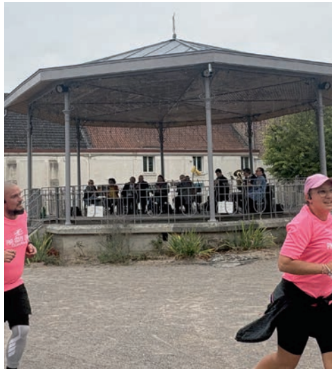
L'harmonie a accompagné musicalement les coureurs

➔ La première, le « Pink Urban Trail » a eu lieu le samedi 11 octobre. Elle a vu le jour grâce à un travail commun avec la municipalité et avec l'aide de plusieurs associations Escaudinoises (les Amis du musée, le Club cyclotourisme, les bénévoles de la mosquée, l'Harmonie municipale ainsi que tous les bénévoles du C.O.M.E.), avec la participation des conseillers municipaux et du personnel de la Médiathèque. 119 participants pour cette première édition. Les inscriptions ont fait office de dons, un chèque de 1 190€ a été remis à l'association EMERA.