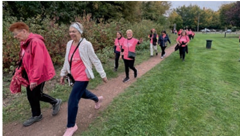
Les marcheurs en direction du terriil