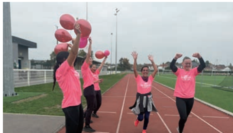
Les jeunes du club à l'arrivée