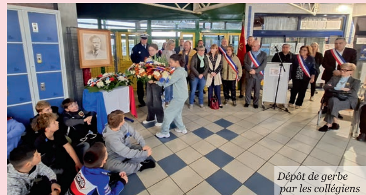
Dépôt de gerbe par les collégiens

Ce temps de recueillement rappelle l'importance de transmettre l'histoire aux jeunes générations, afin que le souvenir de celles et ceux qui se sont engagés pour défendre la liberté demeure vivant et porteur de sens pour l'avenir.