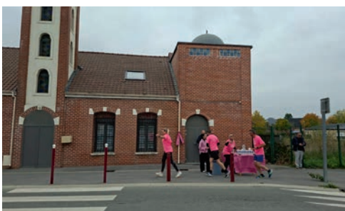
Ravitaillement offert par les bénévoles de la mosquée