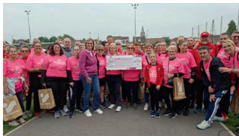
Remise du chèque à l'association EMERA