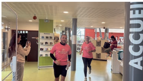
Traversée de la médiathèque