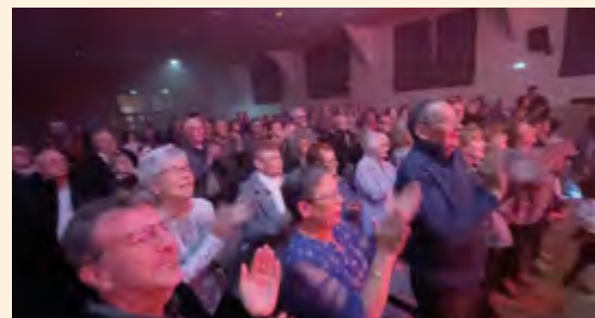
Après plus de 2h de concert sans interruption, la troupe a longuement été applaudie par le public qui a été fantastic tout au long du spectacle.