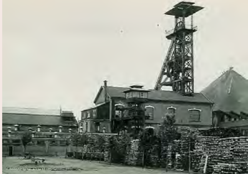
« Fosse Audiffret – le parc à bois » - Site de la ville d'Escaudain.