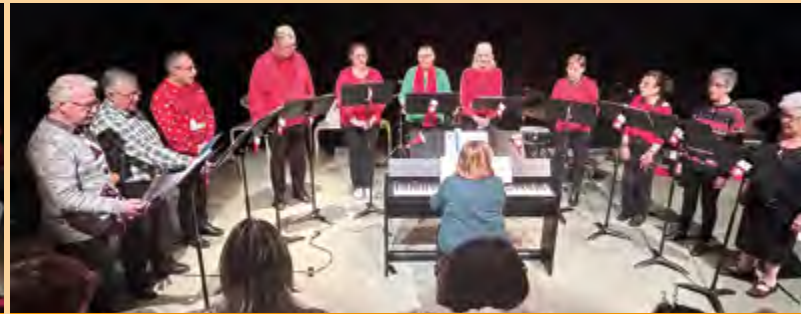
Les choristes d'« Arts en mouvement » ont également participé au concert