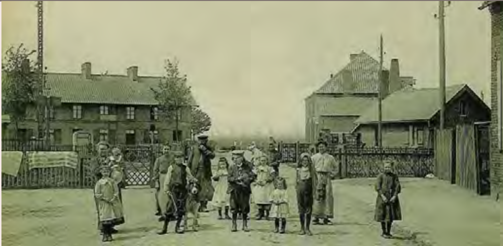
« La halte du Quart-de-Six heures » - Site de la ville d'Escaudain

Escaudain en 1901 ... le train qui transporte le Tsar Nicolas II et sa famille aux festivités de l'alliance Franco-Russe, passe par les Six Marianne. La vie des familles de mineurs dans les corons suit son cours. Dans ces maisons de briques rouges, presque toutes semblables, avec leur « garin » (appentis) et leur bout de jardin. La vie du mineur est rythmée par le travail posté, le matin de 6h à 14h, l'après-midi de 14h-22h, et la nuit de 22h à 6h du matin. Cela permet une extraction du charbon 24h/24. La pose dominicale ne sera instaurée qu'en 1906 et même bien après cette date les mineurs continueront de travailler 60 heures par semaine.