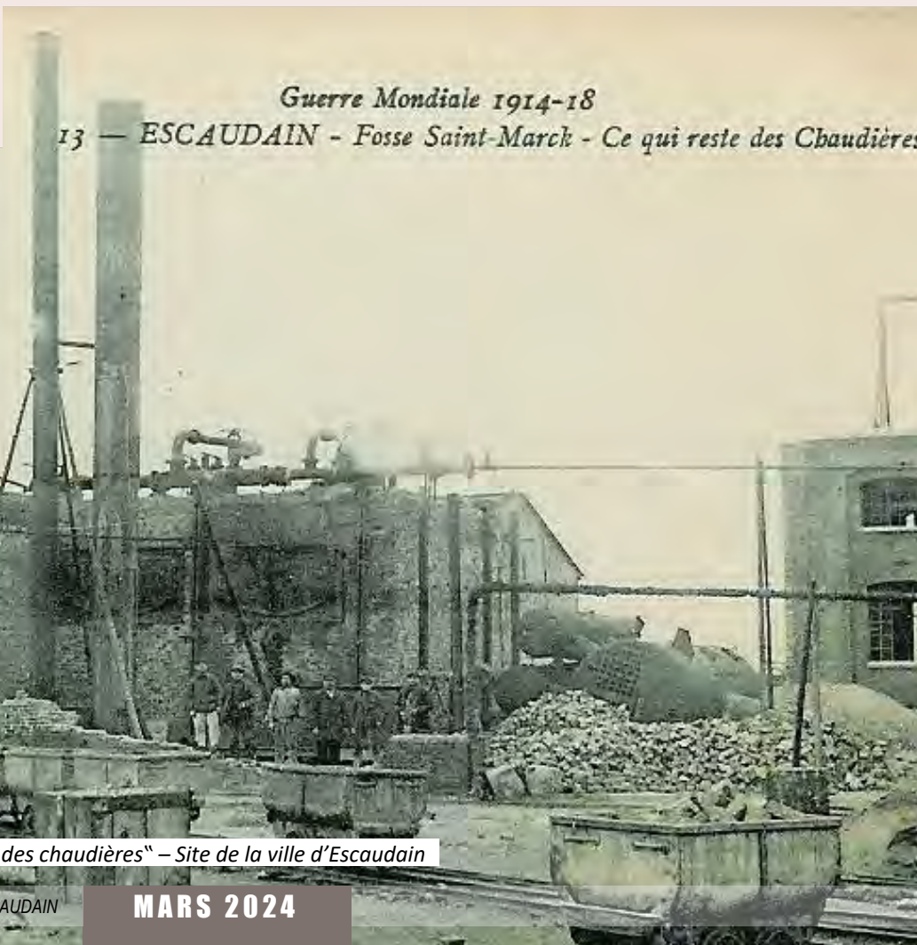
Guerre Mondiale 1914-18 13 — ESCAUDAIN - Fosse Saint-Marck - Ce qui reste des Chaudières