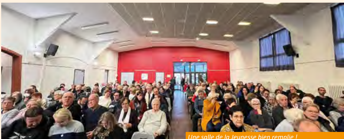
Une salle de la Jeunesse bien remplie !

Un beau rendez-vous musical toujours apprécié par le public Escaudinois. Merci à nos voisins de Wallers et d'Auberchicourt de s'être déplacés volontiers pour assister à cet échange culturel.