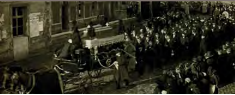
« Enterrement des victimes de la catastrophe de Roelux »

La reconstruction se poursuit jusqu'en 1925. Le bassin minier du Nord-Pas-de-Calais reprend sa première place de producteur de houille National. La fosse Saint Marck est rénovée en béton armé, le lavoir est reconstruit. C'est aussi l'époque de la grande immigration de main d'œuvre étrangère, notamment Polonoise, Italienne et Tchèque.