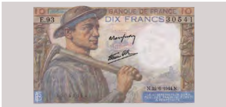
« Billet de 10 francs Mineur 1944 » - Banque de France

Dès 1932, les compagnies décident une baisse de 10% du salaire des mineurs. Les coûts de production pèsent lourd sur les ouvriers, le travail est rationnalisé, malgré l'instauration de périodes de chômage partiel, les compagnies licencient en priorité les travailleurs étrangers. Ainsi, entre 1932 et 1936, 70 000 personnes seront brutalement renvoyées dans leurs pays. Cette crise mondiale, mènera à l'accession au pouvoir du Front Populaire en 1936.