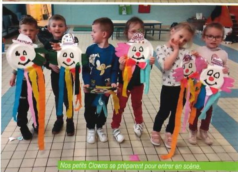
Nos petits Clowns se préparent pour entrer en scène.