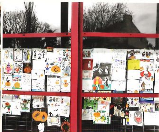
Tous les dessins ont été exposés à l'entrée de la salle de la Jeunesse