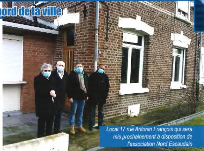
Local 17 rue Antonin François qui sera mis prochainement à disposition de l'association Nord Escaudain

Cette maison sera mise à la disposition des habitants au terme de quelques travaux. L'association Nord Escaudain, opérant sur ce secteur se verra confier la gestion de ce local pour l'intérêt de l'ensemble de la population des quartiers : Couture, Victoire et Alsace.