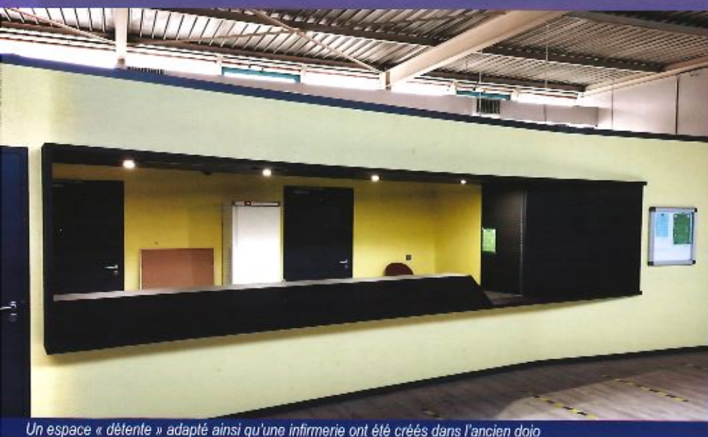
Un espace « détente » adapté ainsi qu'une infirmerie ont été créés dans l'ancien dojo

Les travaux d'extension de la salle Allende sont terminés depuis mi-Février. Le revêtement de sol et les peintures ont été réalisés en règle par nos ouvriers municipaux. Un équipement rénové dont les utilisateurs pourront profiter une fois que les conditions sanitaires le permettront.