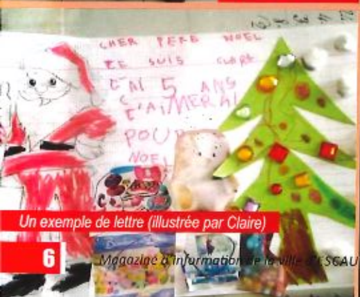
Un exemple de lettre (illustrée par Claire)