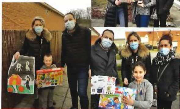
Les 3 lauréats du concours