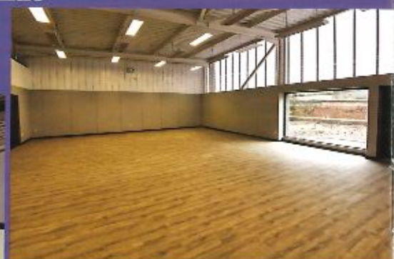
Une salle d'évolution de 125m 2 avec locaux de rangements a été rajoutée, elle permettra d'accueillir les diverses activités et manifestations dans de bonnes conditions et en toute sécurité.