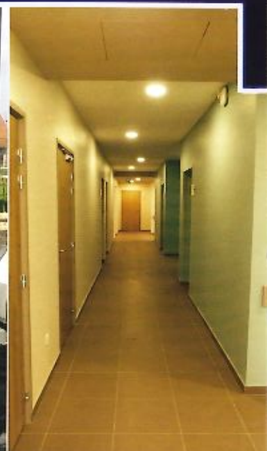
Photo du couloir