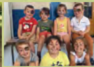
Atelier maquillage pour les Tchoupitchoux