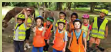
Sortie vélo au parc Maingoval de Douchy-les-mines