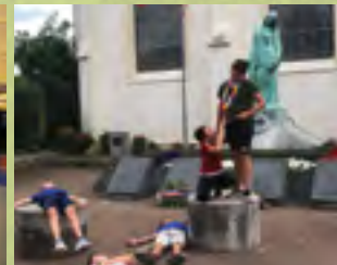
Grand jeu « à la découverte des monuments historiques de la ville »