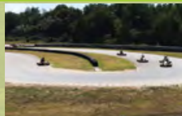
Karting au circuit DKS Motors de Rouvignies