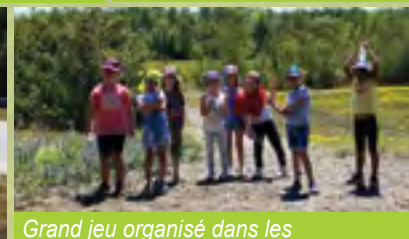
Grand jeu organisé dans les espaces requalifiés « Carrière des plombs »