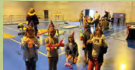
Animations autour du thème du cirque. Petits et grands se sont amusés à travers les différents ateliers proposés par un professionnel du spectacle

impliquées dans la programmation des animations à destination des 3 à 13 ans. L'effectif accueilli a été limité à 110 par semaine, la rotation mise en place lors des inscriptions a favorisé la participation de 200 enfants contre 350 en temps normal. La cohésion de toutes les équipes pédagogiques, leur imagination et leur capacité d'adaptation ont contribué à rendre les enfants heureux. Un ALSH réussi grâce au travail de tous !