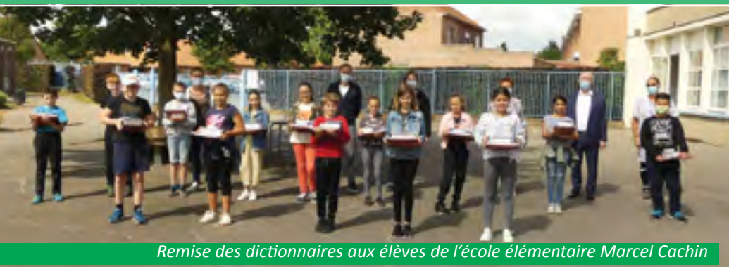
Remise des dictionnaires aux élèves de l'école élémentaire Marcel Cachin

Cette année, malgré la crise sanitaire, la municipalité a offert aux 131 élèves de CM2 entrant au collège, un dictionnaire accompagné d'un ouvrage « Nos Histoires de France » et d'une clé USB. Les directeurs se sont chargés de remettre ces outils aux élèves qui suivaient les cours à domicile et M. le Maire, accompagné de l'Adjointe à l'enseignement, se sont rendus dans les écoles afin de les remettre aux enfants présents.