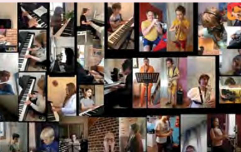
Concert retransmis sur la page Facebook