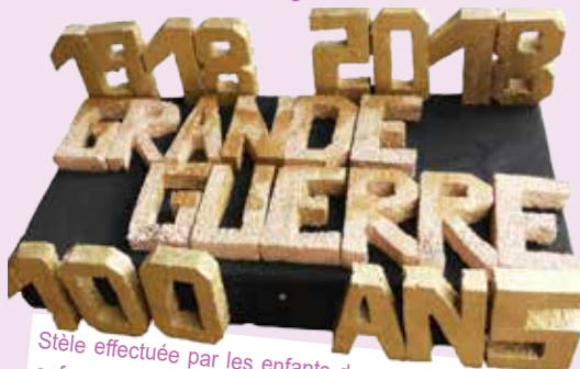
Stèle effectuée par les enfants devant laquelle chaque enfant a déposé son oeillet.

: billes, marelle, cerceaux, quilles mais toujours garçons et filles séparés ! Après cette pause, les enfants ont pu participer à 2 ateliers : réalisation d'un bleuet en papier crépon, et de Nénette - Rintintin, couple de poupées porte-bonheur apparu à la fin de la première guerre mondiale.