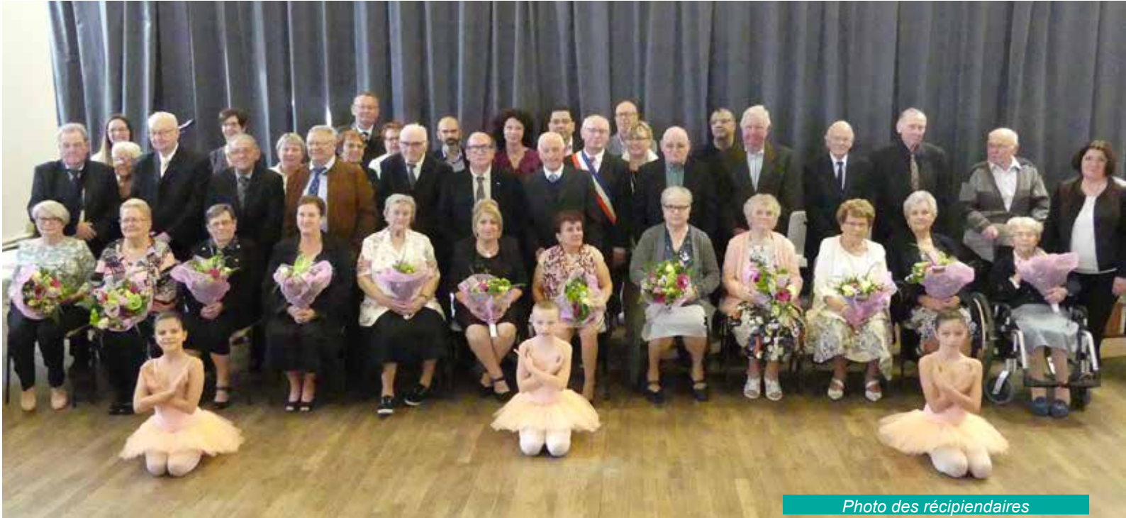
Photo des récipiendaires

Le Dimanche 14 octobre dernier, la commune a organisé sa traditionnelle cérémonie des noces d'or. Douze couples et leur famille ont été reçus.