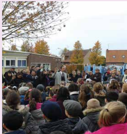
11h11 : rassemblement des enfants et des enseignants dans la cour de l'école