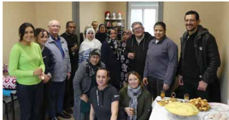
Rencontre avec les Pensées d'Astrid (nouvelle association du Quart de Six Heures)