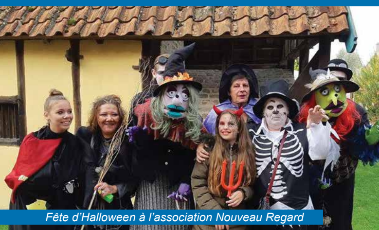
Fête d'Halloween à l'association Nouveau Regard