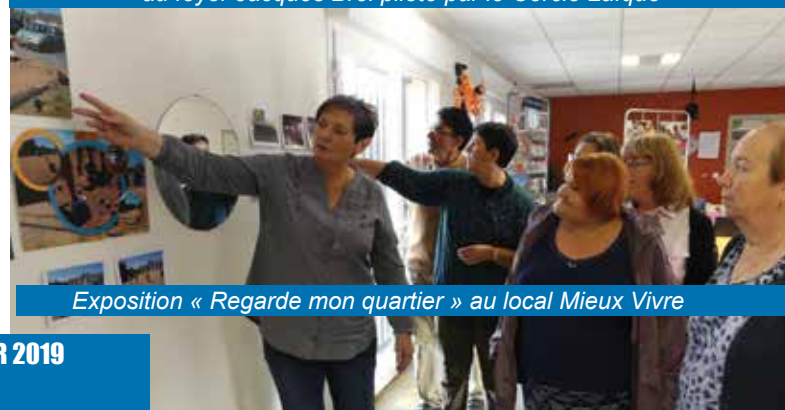
Exposition « Regarde mon quartier » au local Mieux Vivre