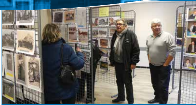
Exposition « Regarde mon quartier » au local de la cité Nervo