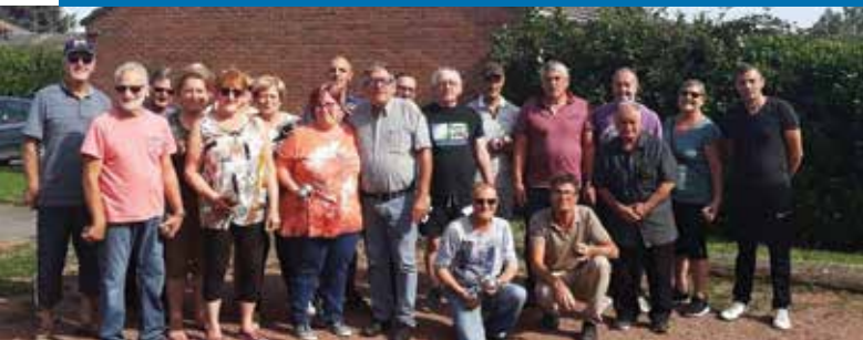
Activité pétanque à l'association Mieux vivre (Résidence Louise Michel et Picasso)