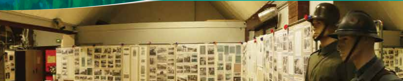
Vernissage de l'exposition en présence de l'association et des membres du Conseil Municipal