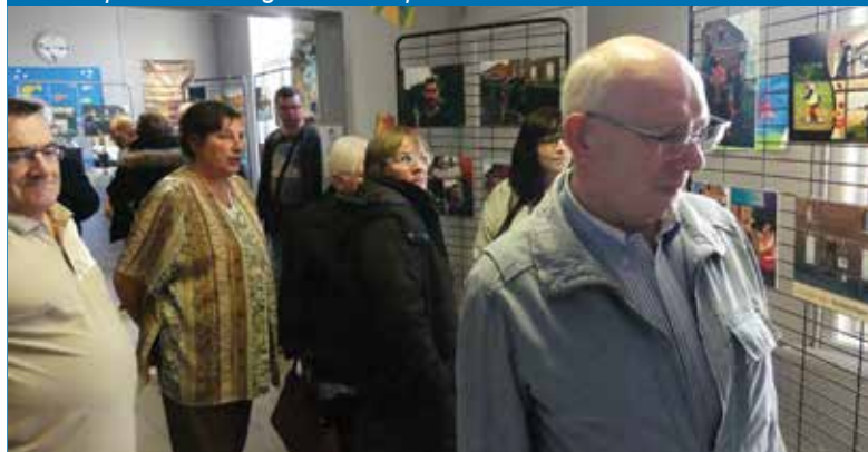
Exposition « Regarde mon quartier » de Nouveau Regard