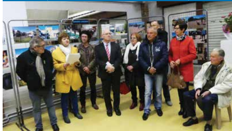
Vernissage de l'exposition « regarde mon quartier » au foyer Jacques Brel piloté par le Cercle Laïque