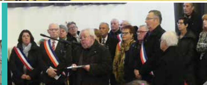
Compte tenu des mauvaises conditions météorologiques, c'est à la salle de la Jeunesse que les prises de paroles se sont déroulées