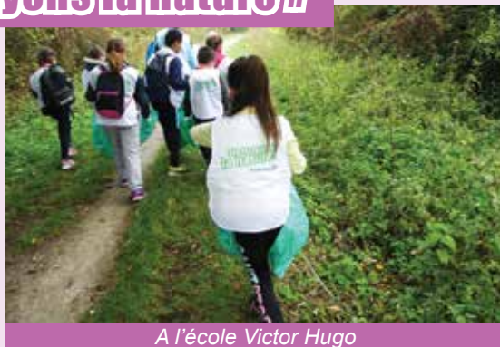
A l'école Victor Hugo

Les élèves des écoles élémentaires Victor Hugo et Roger Salengro ont participé à l'opération « Nettoyons la nature », certains se sont rendus dans les friches quand d'autres ont nettoyé les abords de leurs écoles. Cette opération sert un double objectif : agir concrètement pour la préservation de l'environnement tout en sensibilisant le plus largement possible à un sujet qui nous concerne tous.