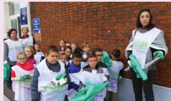
A l'école Elémentaire Salengro