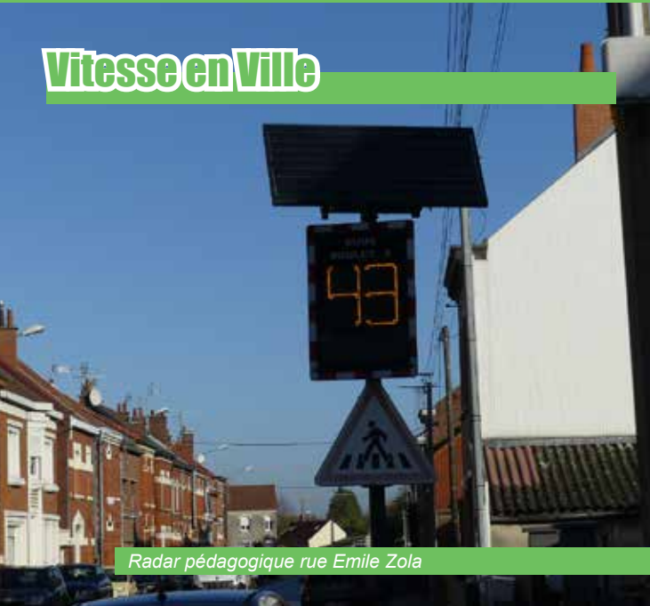
Radar pédagogique rue Emile Zola

Ces dernières années, la municipalité, soucieuse de la sécurité de ses concitoyens, a consacré plus de 200.000€ pour l'achat de matériels, mise en place de divers dispositifs et réalisations de travaux destinés à réduire la vitesse des véhicules en agglomération.