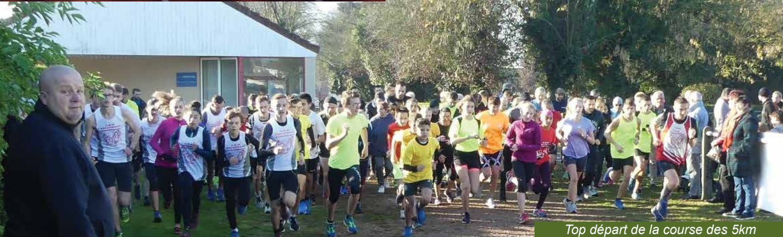
Top départ de la course des 5km

Le club remercie l'ensemble des personnes ayant de près ou de loin participé à cette journée et donne dès à présent rendez-vous pour le 2 ème CROSS « André LELEU » Dimanche 20 octobre 2019.