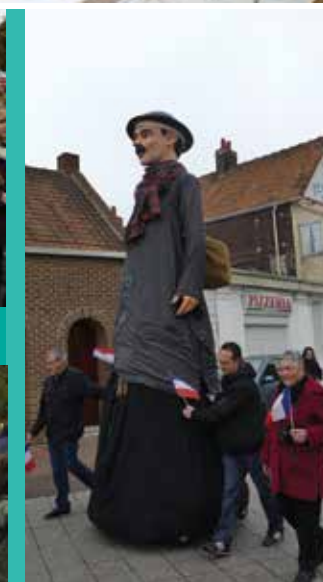
Derrière le cortège le géant « Pierre Gailllette » fermait la marche