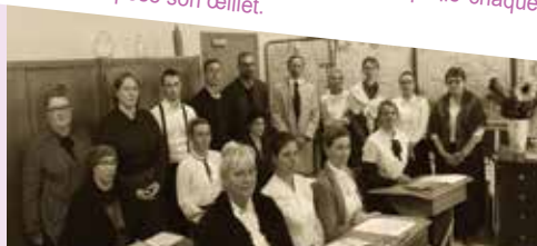
L'équipe pédagogique au grand complet, Voyez ces beaux vêtements d'époque