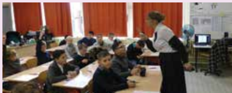
A cette époque pas de professeur des écoles mais une institutrice qui fait cours « à l'ancienne »