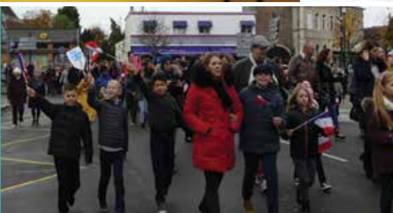
Les Directrices et Directeurs d'écoles avaient mobilisé leurs élèves pour ce devoir de mémoire