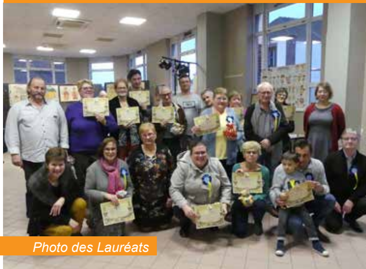
Photo des Lauréats

Cette année, il sagissait de « repasser son certif » dans le cadre de la semaine de la laïcité et en partenariat avec la Ligue de l'Enseignement.