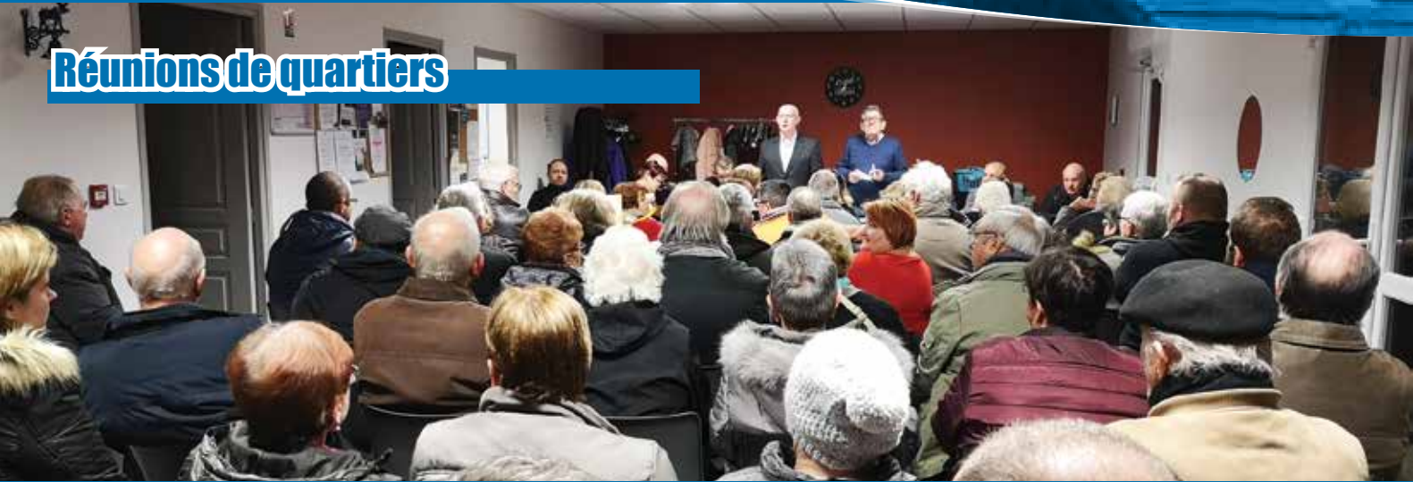
Une des 7 réunions de quartiers qui a permis des échanges fructueux entre la municipalité et la population (ici au local Louise Michel)