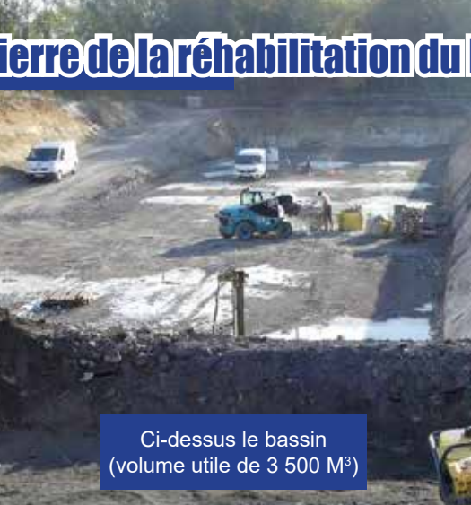
Ci-dessus le bassin (volume utile de 3 500 M 3 )

Montant des travaux : 1 645 000€ TTC. Ces travaux s'achèveront au Printemps.