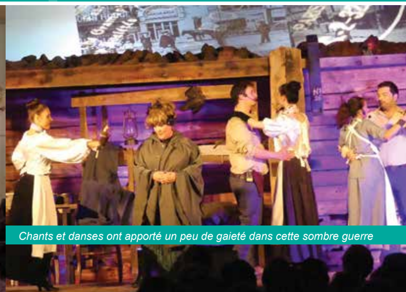
Chants et danses ont apporté un peu de gaieté dans cette sombre guerre