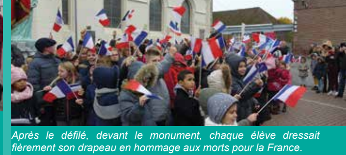
Après le défilé, devant le monument, chaque élève dressait fièrement son drapeau en hommage aux morts pour la France.