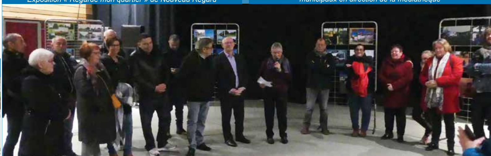
Exposition « Regarde mon quartier » à la médiathèque, l'association Nord Escaudain