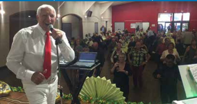
Repas dansant des aînés du Comité des Fêtes de la Cité Nervo