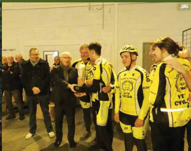
Remise de la coupe de Monsieur le Maire aux « Renards des sables » de Flines-lez-Raches, club le plus représenté cette année

Merci aux 781 VTT des Hauts de France, mais aussi de Belgique qui ont participé à ce rassemblement, ainsi qu'aux 162 marcheurs souvent accompagnés de leur animal à quatre pattes. Le club vous donne rendez-vous l'année prochaine pour la 24 ème édition