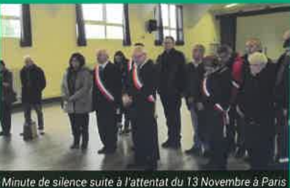
Minute de silence suite à l'attentat du 13 Novembre à Paris