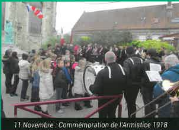
11 Novembre : Commémoration de l'Armistice 1918