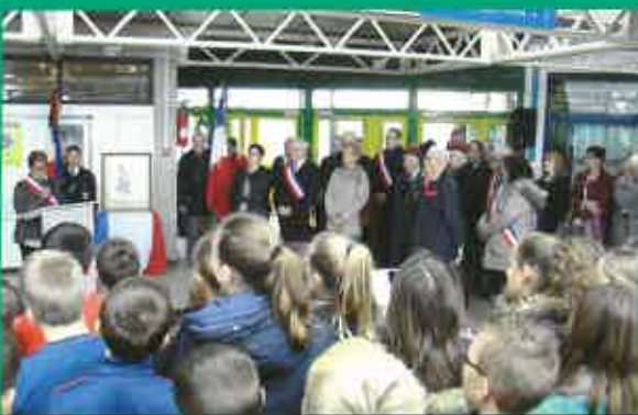
Hommage en la mémoire de Félicien Joly