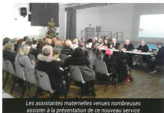
Les assistantes maternelles venues nombreuses assister à la présentation de ce nouveau service

l'accueil du jeune enfant de 0 à 3 ans. L'absence de services dans le domaine de la petite enfance et plusieurs demandes de la population ont amené la commune à envisager divers projets. Grâce au soutien de la Caisse d'Allocations Familiales, la municipalité a décidé de créer un Relais Assistantes Maternelles. Celui-ci a ouvert ses portes le 1 er janvier.