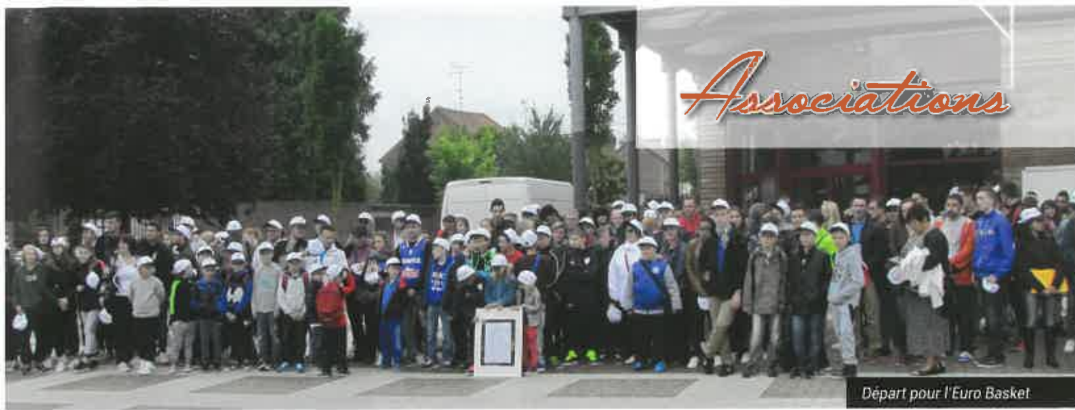
Départ pour l'Euro Basket