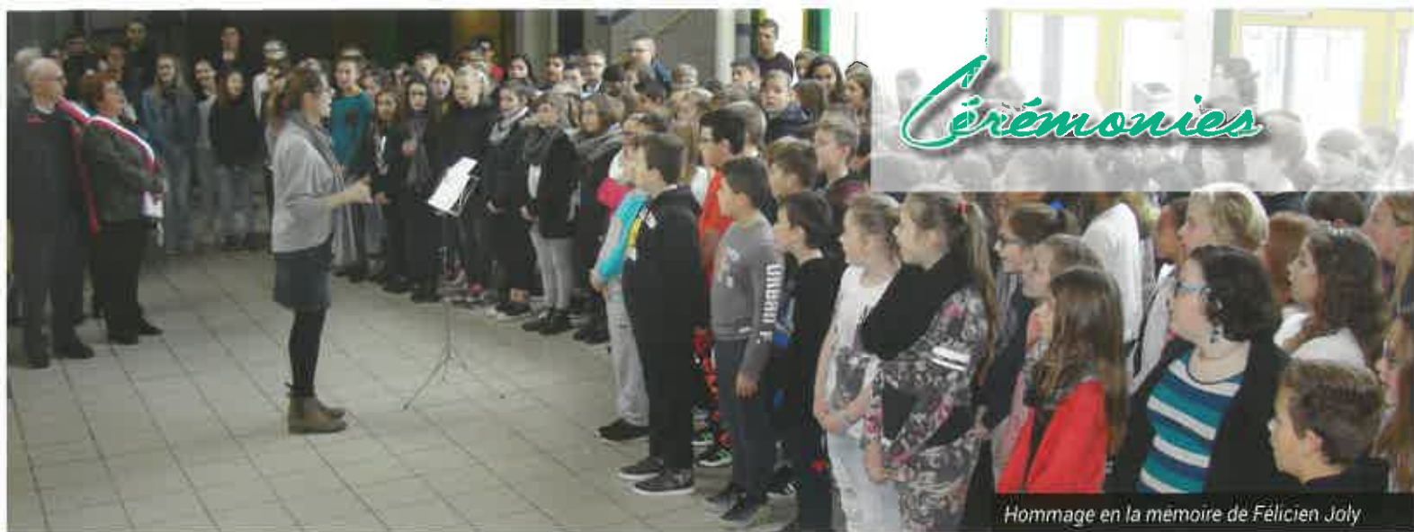
Hommage en la mémoire de Féliçien Joly