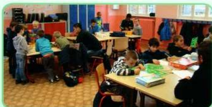
Jeux de société à l'école Renan