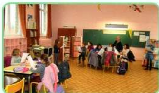
Initiation au théâtre à l'école Renan

Le fonds d'amorçage qui sera versé par l'Etat en 2015 et, semble-t-il, en 2016, sera indispensable pour maintenir la qualité de ce nouveau service imposé aux Maires par la loi. Espérons que cette aide sera pérennisée.