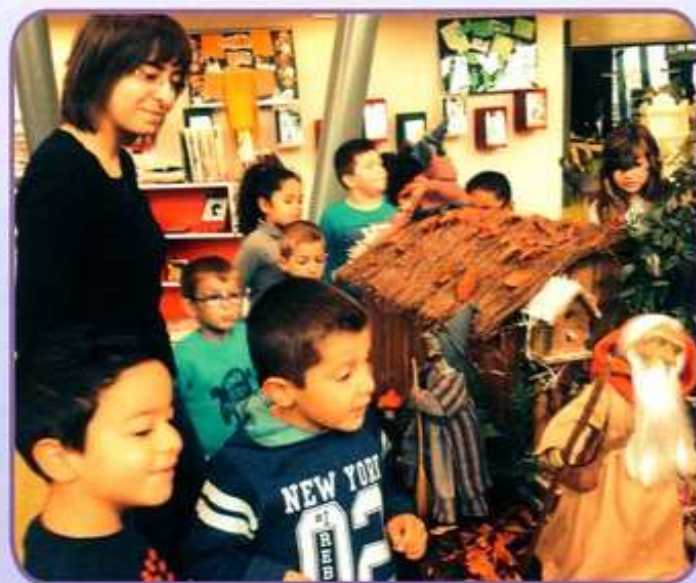
Exposition d'Halloween à la médiathèque