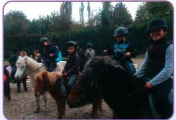
Initiation à l'équitation au centre équestre d'Escaudain