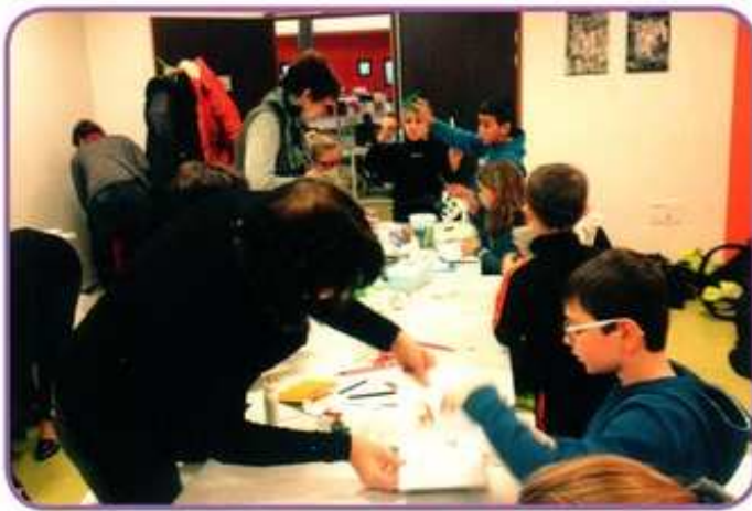
Atelier scrapbooking à la médiathèque