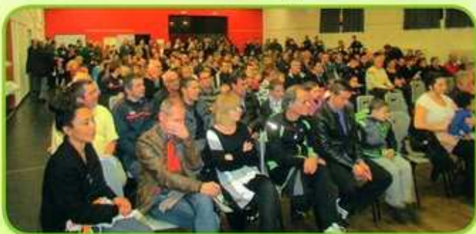
De nombreux sportifs étaient présents