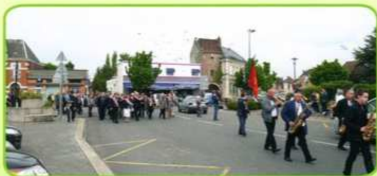
A chaque défilé, l'association organise un lâché de pigeons sur la place Gambetta

Pour les personnes intéressées, les membres de l'association vous invitent à les rejoindre. Le local est situé 140 rue Emile Zola.