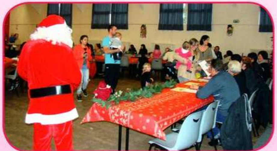
Remise des cadeaux par le Père Noël