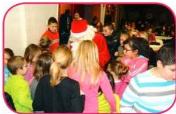
L'arrivée du père Noël a fait des heureux !