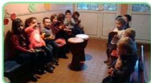
Eveil musical aux écoles Simon et Cachin

Environ 350 enfants sont inscrits aux activités le lundi (écoles René Simon-Mme de Sévigné, Ernest Renan, Victor Hugo et Paul Langevin), 330 le mardi (écoles Marcel Cachin, Roger Salengro et Paul Schneider) et au total 680 le jeudi pour l'ensemble des écoles.