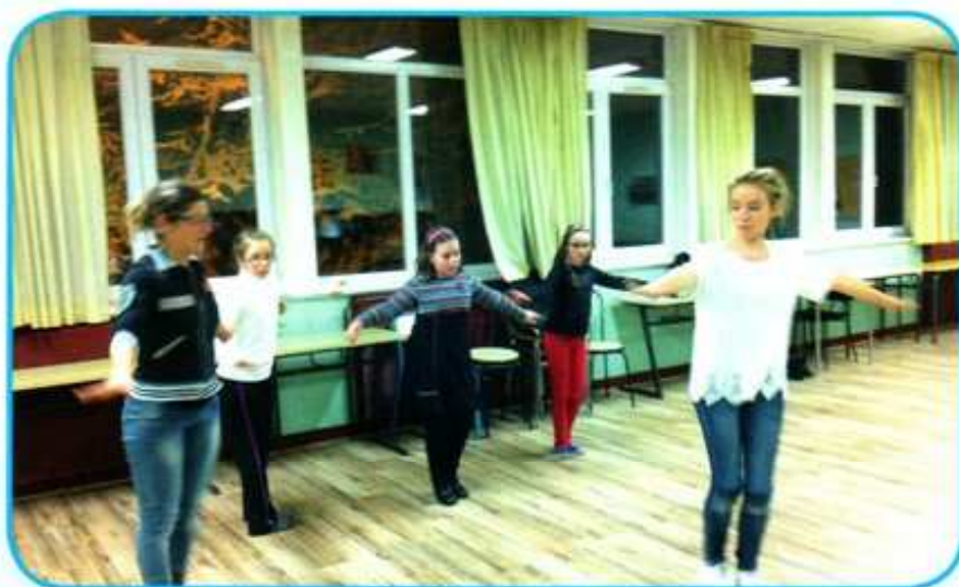
Les ateliers « Chant thé danse »