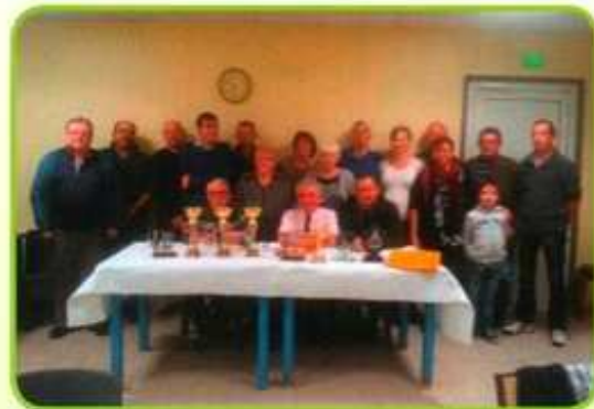
Les membres du club lors de la dernière assemblée générale

Le Samedi 22 Novembre, l'association Escaudinoise « Le Pigeon de Fer » a organisé son assemblée générale suivie de la remise des prix pour la saison 2014.