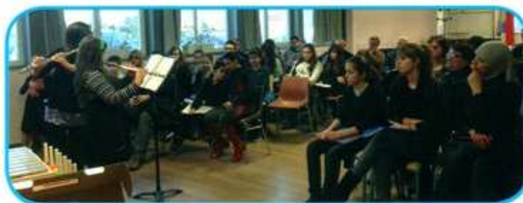
Audition des élèves

Je suis en CP ou CE1, je viens de découvrir les instruments dans mon école et j'ai très envie d'aller essayer. Je viens 1/2h par semaine pour commencer à apprendre l'instrument que l'école a loué à mes parents. Je participe avec les autres aux petits concerts et au mois de Mai, je joue mon morceau pour montrer que j'ai bien travaillé. Au mois de Juin, j'assiste à la remise des prix et je reçois mon diplôme ! En CE2 je commence la formation musicale, le solfège, pour bien savoir lire la musique et commencer à me débrouiller tout(e) seul(e). Ensuite je participe à l'orchestre des jeunes de l'école avec mes copains musiciens, et quand je serai grand (dans 3 ou 4 ans), je pourrai faire partie de l'harmonie.