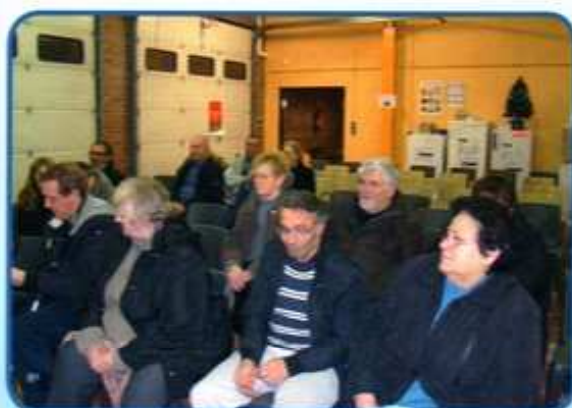
Réunion avec les habitants du quartier du Six Mariane