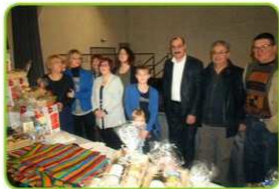
L'union des commerçants avant la remise des lots

En plus des lots offerts par le groupement (dont un vol en montgolfière), l'union a remis des micro-ondes et des paniers garnis. La prochaine opération commerciale sera organisée du 1er au 12 décembre 2014.