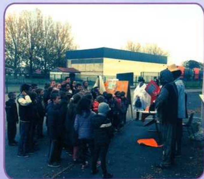
Grand jeu des petits monstres

- Activités sportives : Piscine, randonnée VTT, Equitation à Escaudain, Rollers, zumba, culturelles : Karaoké, création d'un jeu de société, Atelier Scrapbooking à la Médiathèque communautaire, sortie de Noël cinéma le Gaumont Valenciennes, le Hobbit «la bataille des cinq armées» et séance au Laser Game ou manuelles : Ateliers à la Médiathèque communautaire (Exposition et jeux autour du thème d'Halloween, Combat des chefs cuisiniers organisé par la CAPH dans le cadre du programme VIF), grand jeu « la Magie d'Halloween» et enfin les sorties : au cinéma gaumont « Ninja Turtles » et à Walibi Belgique « A la rencontre des petits monstres ».