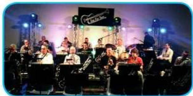
Le « Tea For Two Big Bang »

Le jeudi 20 novembre, troisième jeudi du mois, l'harmonie a organisé sa traditionnelle soirée cabaret pour la sortie du beaujolais nouveau 2014.