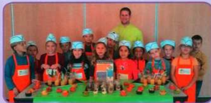
Atelier « chef cuisinier » organisé par la CAPH