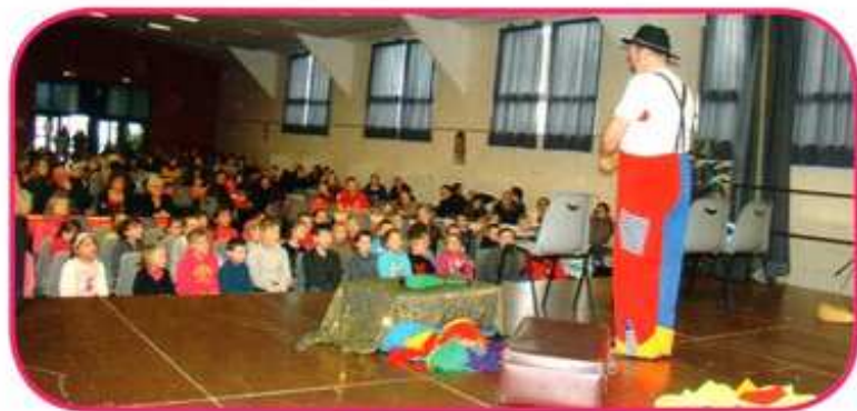
Les enfants en admiration devant le clown

Le père Noël fit enfin son apparition. Ce fut le signal de la distribution des cadeaux que les enfants apprécièrent unanimement.