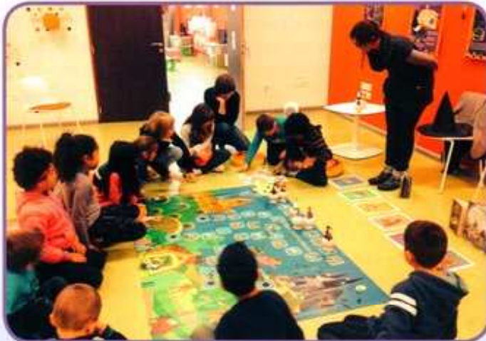
Jeu sur le thème des sorcières d'halloween