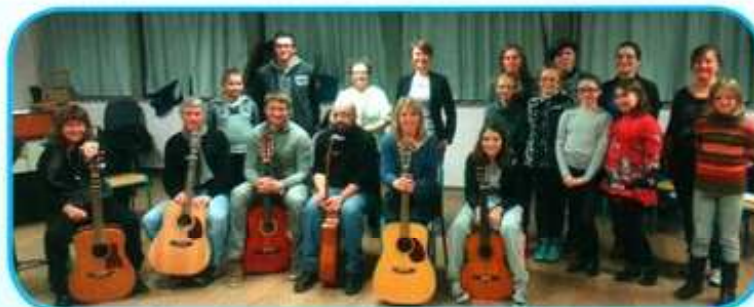
Orchestre « Musiques actuelles »