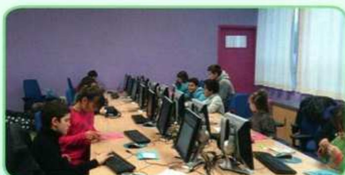
Initiation à l'informatique à l'école Schneider