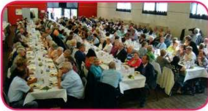
Ambiance très chaleureuse dans la salle de la Jeunesse