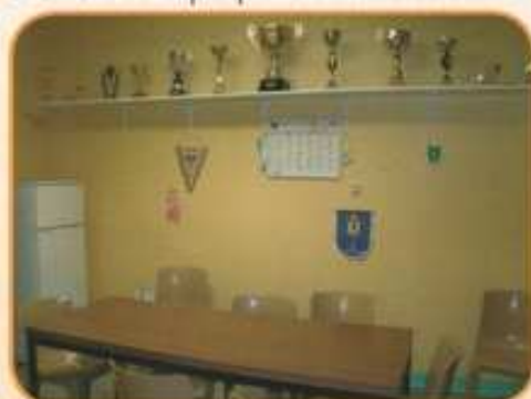
La salle de réunion du club de basket féminin

Après le décès d'André JOLY, les dirigeants du club de basket féminin ont émis le souhait de voir son nom attribué à leur « clubhouse », souhait que le conseil municipal a exaucé lors de sa réunion du 23 octobre 2012 et qui s'est vu concrétisé par le dévoilement de la plaque lors d'une cérémonie intimiste organisée le 24 janvier dernier en présence notamment des proches d'André, des membres du club et d'élus municipaux. L'occasion de rendre un nouvel hommage à une figure emblématique pour le club et de se remémorer quelques bons souvenirs.